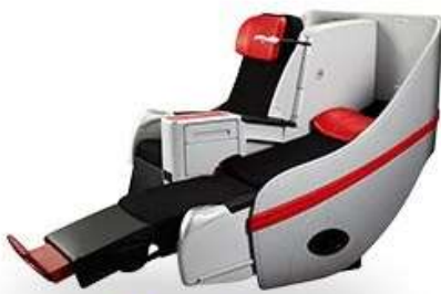
พรีเมียมฟลัดเบด