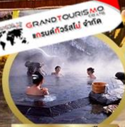
พักออนเซ็น 1 คืน