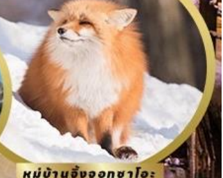
หมู่บ้านจิ้งจอกซาโอะ