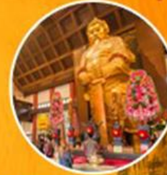
วัดเขกงหมิว