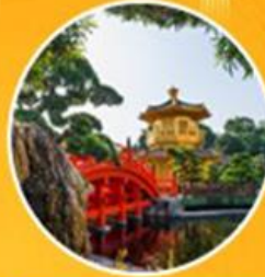
วัดนางชี