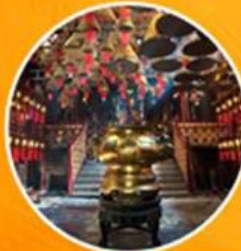
วัดห่านโหมว