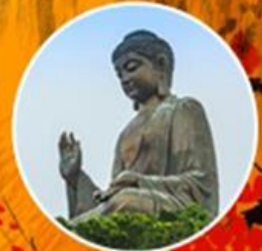
วัดโปหลิน