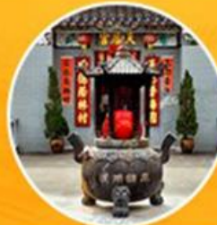
วัดกีนหัว