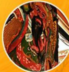
วัดหล่งโหมว