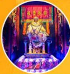
วัดคุณยัม