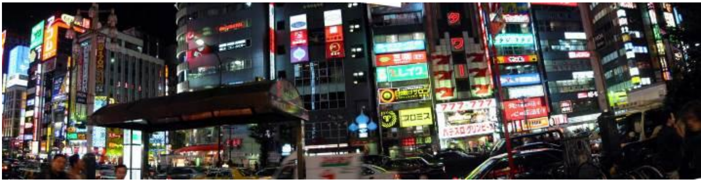
คำ อธิระอาหารค่ำตามอัธยาศัย ที่พัก RYOKOKU VIEW HOTEL หรือเทียบเท่า ระดับ 3 ดาว

ร่วง ซึ่งอาจจะมิลมพัด ทำให้รู้สึกหนาวมากขึ้น ควรเตรียมเสื้อหนาวและเสือกันลมมาให้พร้อม) ... นำท่านเดินทาง สู่ “ทะเลสาบชูเซนจิ” อยู่ทางตะวันตกของเมืองนิกโก้ ข้างกับภูเขาศักดิ์สิทธิ์ นันไต (Mt.Nantai) โดยปกติทะเลสาบก็มักจะ อยู่ตั้งบนพื้นราบ แต่กับ ทะเลสาบชูเซนจิ( Chuzen-ji) นั้นตั้งสูงกว่าระดับน้ำทะเลถึง 1,269 เมตร นับว่าเป็นทะเลสาบ ธรรมชาติที่ตั้งอยู่สูงที่สุดในญี่ปุ่นเลยทีเดียว ... จากนั้นนำท่านเดินทางสู่กรุงโตเกียว ... เพื่อนำท่านเดินทางสู่ย่านช้อปปิ้ง “ชินจูกุ” ย่านแห่งความเจริญอันดับหนึ่งของกรุงโตเกียว ท่านจะได้พบกับห้างสรรพสินค้า และร้านขายของนับเป็นพัน ๆ ร้าน ซึ่งจะมีผู้คนนับหมื่นเดินกันขวักไขว่ ถือเป็นจุดที่นัดพบยอดนิยมอีกด้วย เชิญท่านเลือกชมสินค้ามากมาย อาทิเช่น เครื่องใช้ไฟฟ้า, กล้องถ่ายรูปรุ่นล่าสุด, IPOD, MP-3, NOTEBOOK, SANRIO SHOP, GAMES SHOP, นาฬิกา, เสื้อผ้า, รองเท้าแฟชั่นทันสมัย และเครื่องสำอาง เป็นต้น