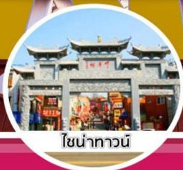
โซน่าทาวน์