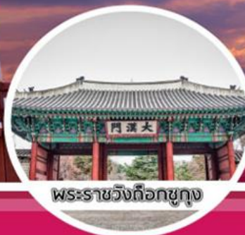
พระราชวังต็อกซูกุง

GRANDTOURISMO CO.,LTD แกรนด์ทัวร์ริสโม จำกัด