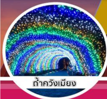
ถ้าควังเมียง