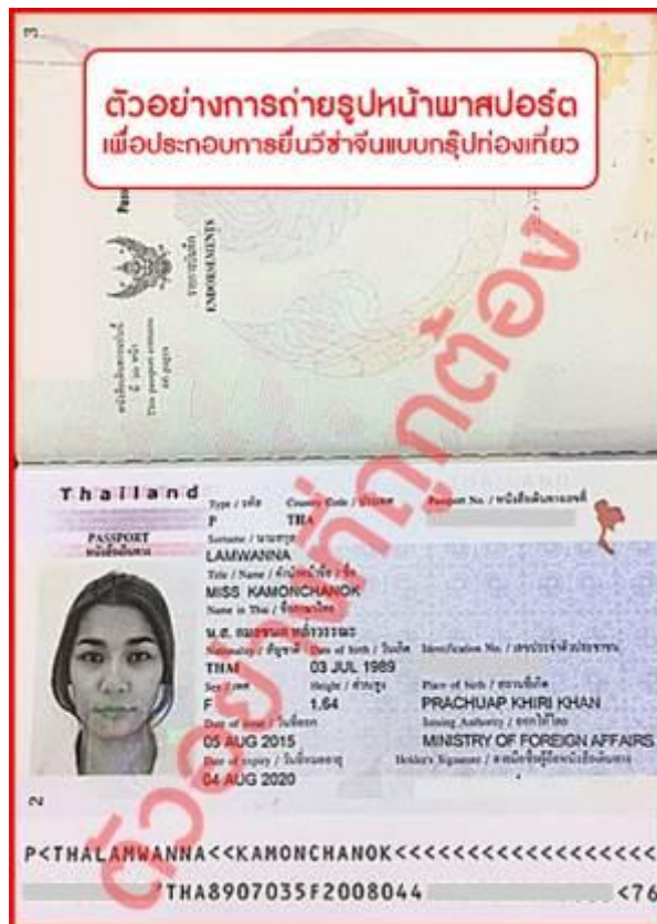
ต้องถ่ายให้ติดทั้ง 2 หน้าแบบตัวอย่าง