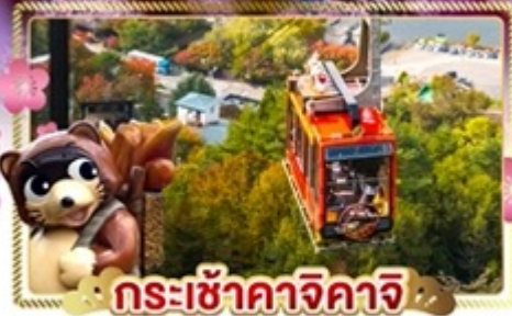
กระเช้าคาจิคาจิ