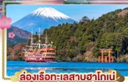
ล่องเรือทะเลสาบฮาโกเน่