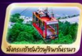
นั่งกระเช้าชมวิวฟูจิพาโนรามา