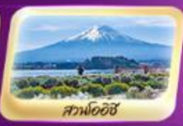
สวนโออิชิ