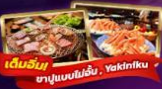
เด็บริบ ชาบูแบบไฟร้อบ . Yakifuku