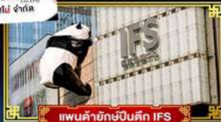
แพนด้ายักษ์ป็นตึก IFS