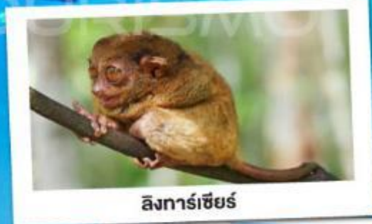
ลิงการ์เซียร์