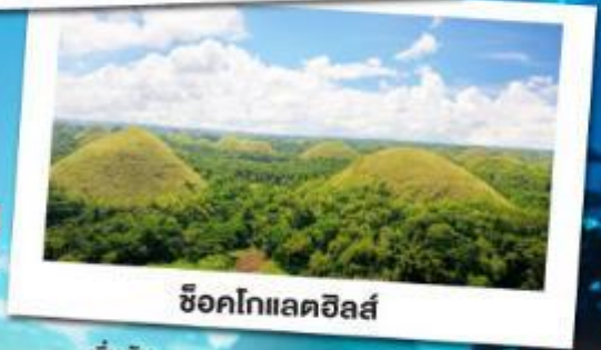
ช็อคโกแลตฮิลล์