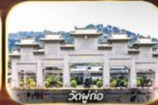
วัดฟักอ๋อง