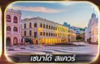
เซนาดี สแควร์

เที่ยวเต็มอิ่ม ไหว้พระ-วัดดัง นั่งรถโค้ชขึ้นสะพานข้ามทะเลที่ยาวที่สุดในโลก ช้อปบิงจู่ใจ : เซนาดีสแควร์, ตลาดใต้ดินก่งเป๋ย, ย่านจิมซาจุ่ย