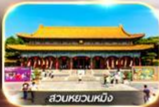
สวนหยวนหมิง