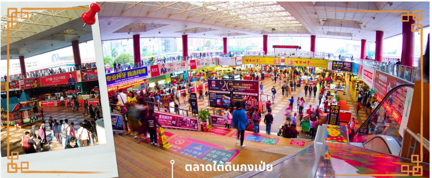
ตลาดใต้ดินกงเป๋ย

จากนั้นนำท่าน อิสระช้อปปิ้งตลาดใต้ดินกงเป๋ย ตั้งอยู่ติดชายแดนมาเก๊า เป็นศูนย์การค้าติดแอร์ ที่มีร้านค้ามากกว่า 5,000 ร้านค้า มีสินค้าให้ท่านเลือกมากมาย เช่น สินค้าก๊อปปี้แบรนด์เนมต่างๆ ไม่ว่าจะเป็นเสื้อผ้า รองเท้า กระเป๋า นาฬิกา ของเด็กเล่น ฯลฯ ที่นี้ มีสินค้าให้เลือกซื้อหลากหลาย จึงเป็นที่นิยมมากของชาวมาเก๊าและฮ่องกง เนื่องจากสินค้าที่นี่มีคุณภาพและราคาถูก