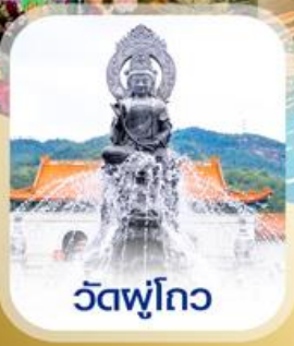
วัดพุทโธ