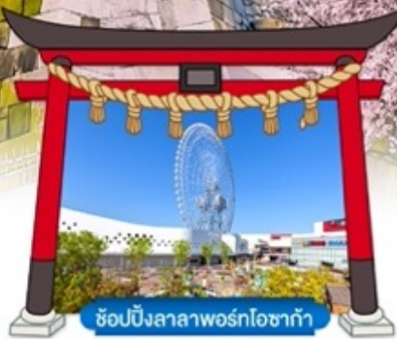
ช้อปปิ้งลาลาพอร์ทโอซาก้า