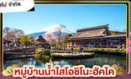
หมู่บ้านน้ำใสโอชิโนะฮักโค