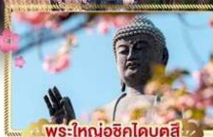
พระใหญ่อุซึคุโดบุตสึ