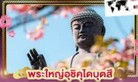
พระใหญ่อุซึคุโดบุตสึ