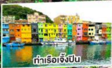
ท่าเรือเจี๊ยะปิ่น