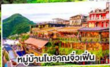
หมู่บ้านโบราณจื่อเฟิน