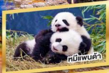
หมีแพนด้า