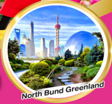
North Bund Greenland