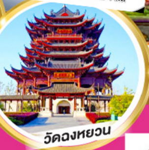
วัดหลงหยวน