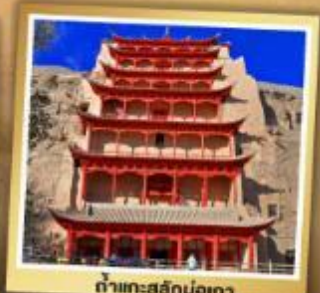
ถ้ำทะสีกม่อเกา