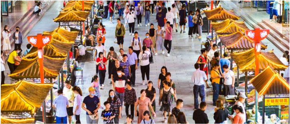
สมควรแก่เวลานำท่านเข้าสู่ที่พัก