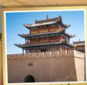
กำแพงเมืองด่านเจียชี่กวน