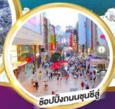
ช้อปปิ้งถนนชุนชิว