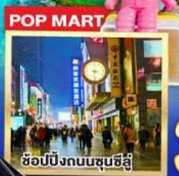
ช้อปปิ้งถนนชุนชิว