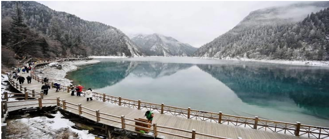
ทะเลสาบยาว ใหญ่ที่สุดในจังหวัดไอวากิ ยาวกว่า 7 กิโลเมตร อยู่ท่ามกลางขุนเขาในบรรยากาศที่เงียบสงบแต่งดงาม ชม