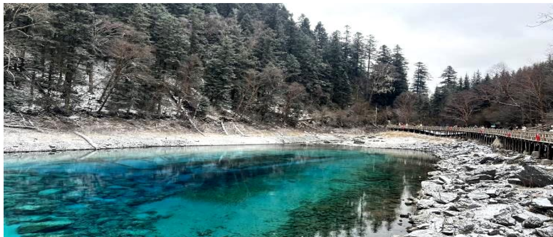
ทะเลสาบ5สี เป็นทะเลสาบที่มีสีของน้ำแปลกตา โดยเฉพาะเมื่อยามแสงอาทิตย์ตกกระทบพื้น สีของน้ำในทะเลสาบจะเปล่งประกายเป็นสีรุ้งงดงามมาก เป็นอุทยานที่เหมาะแก่การไปถ่ายพีวีเอดิ่งริมหิมเทพนิยามากๆ