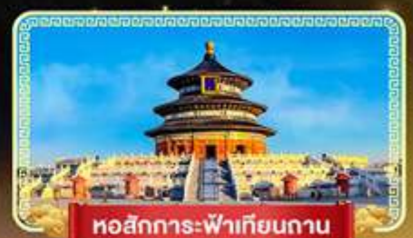
หอสักการะฟ้าเทียนถาน