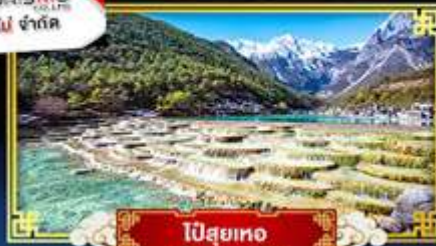
ไป๋สุยเหอ