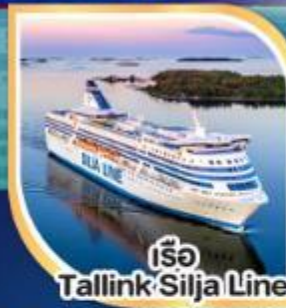
เรือ Tallink Silja Line

05-13, 12-20 เม.ย., 03-11 พ.ค.68 10-18 พ.ค., 04-12 ต.ค.68 11-19, 18-26 ต.ค.68