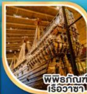
พิพิธภัณฑ์ เรือวาซา