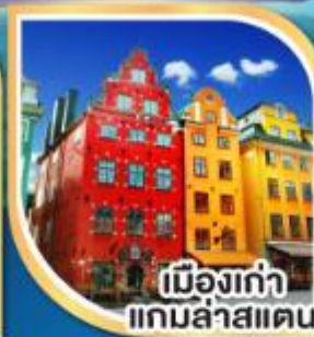
เมืองเก่า เกมล่าสแตน