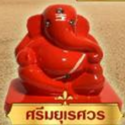
ศรีมยุรศวร