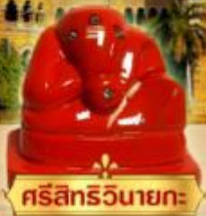
ศรีสิทธิวินายกะ