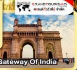
Gateway Of India

พิเศษ! เสริมบาร์มีก่อนใครที่วัด Trishandu Ganesh Temple "คณศวรวงง ศรีสุล"