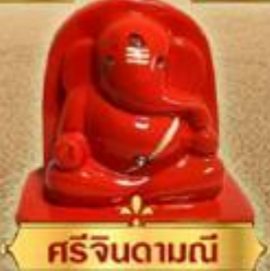
ศรีจินดามณี