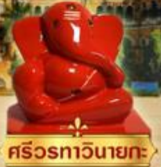
ศรีรทาวินายกะ