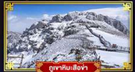
ภูเขาหิมะสีอง่า