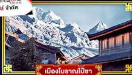
เมืองโบราณปี้ซา