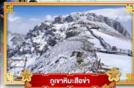
ภูเขาหิมะซือซ่า