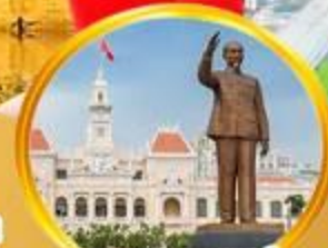
นครโฮจิมินห์

9-15 ก.พ. / 15-21 มี.ค. / 19-25 เม.ย. 68