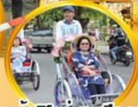
สามล้อซิคเล..ชมเมืองเก่า