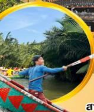
นั่งเรือกระดังง์