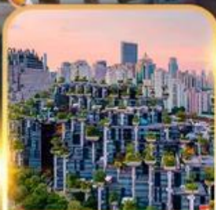
Tian An 1000 Trees