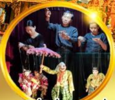
ชมโชว์เชิดหุ่นกระบอกพม่า

ย่างกุ้ง หงสาวดี พระธาตุนครอินทร์แขวน พุกาม มัทกะเลย์ 5 วัน 4 คืน