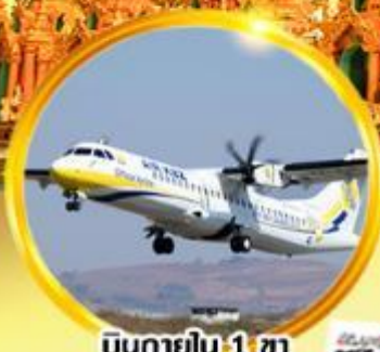
บินภายใน 1 ชม