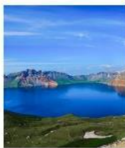
อุทยานดาวไปซาน