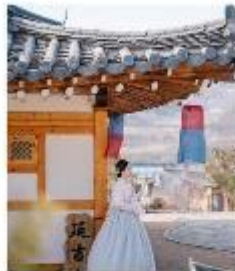
สวนวัฒนธรรม พื้นบ้านเกาหลี