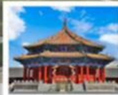
เล่นหยางกู่กิง

GRANDTOURISMO CO.,LTD. แกรนด์ทัวร์ริสโม จำกัด