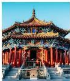
พระราชวังกุ๊กกวง