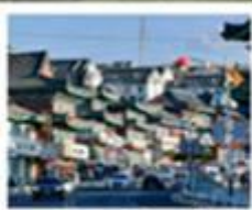
เมืองเหียนจี้