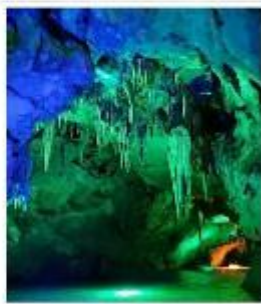
ถ้ำน้ำเป็นชี