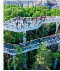
สวนต้นสน