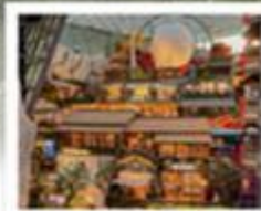
THE HILL CHANGCHUN