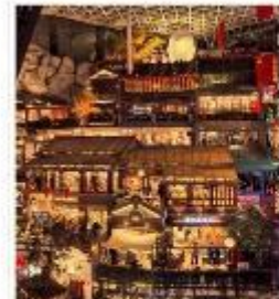
THE HILL CHANGCHUN