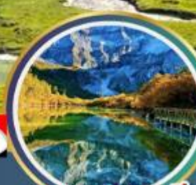
ทะเลสาบ 5 สี