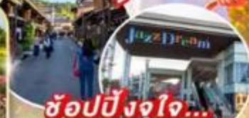
ช้อปปิ้งจุใจ... Mitsui Outlet Park