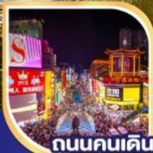
ถนนคนเดิน หวงซิงลู่