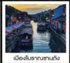
เมืองโบราณซางตง