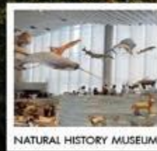
NATURAL HISTORY MUSEUM

North Bund Green Land / The bund weekend market BFC