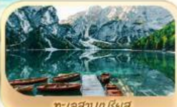
ทะเลสาบเบริงส์

เมนูพิเศษ ขาหมูเยอรมัน สปาเก็ตตี้หั่นหมักดำ