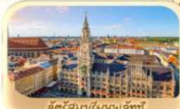
จัตุรัสมาเรียพลาซซ์