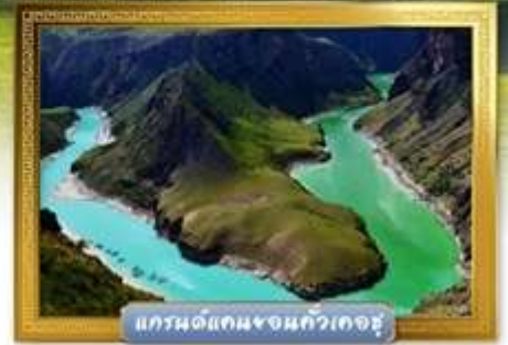
แกรนด์แคนยอนกัวเคอซู

เดินทางโดย : สายการบินโซนาเซาเทิร์นแอร์ไลน์