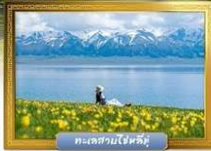
ทะเลสาบไซหลิมู่