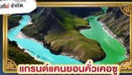
แกรนด์แคนยอนคิ้วเคอซู