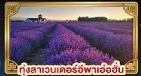
ทุ่งลาเวนเดอร์อูฟาเอ่ออัน