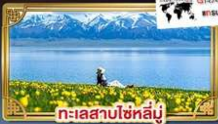
ทะเลสาบไซหลิน

ชมวิวทุ่งหญ้าลอยฟ้า "นาราตี" สวยงามดุจเทพนิยาย