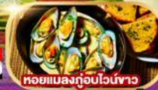
หอยแมลงภู่อวบน้ำ