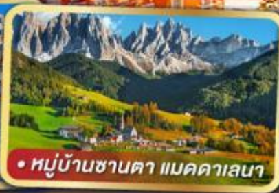
• หมู่บ้านซานตา แมคคาเลนา