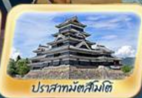
ปราสาทมัตสึมิโต