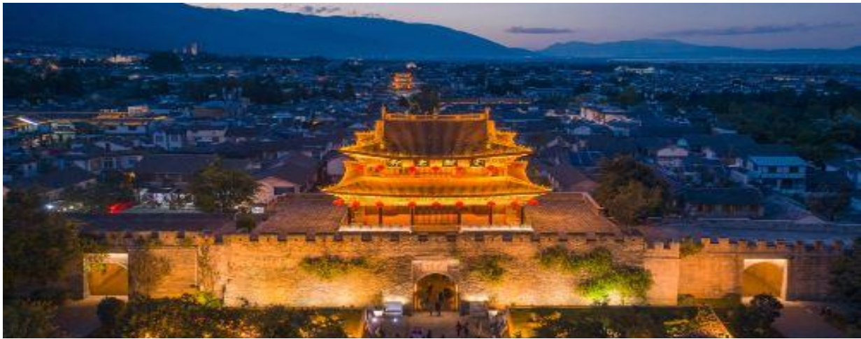
ที่พัก DALI DAYS WYHDAM HOTEL หรือเทียบเท่าระดับ 4 ดาว