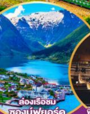
ล่องเรือชม ซอกน์ฟยอร์ด