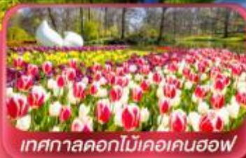
เทศกาลดอกไม้อะเคอเคนฮอฟ