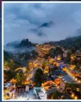
หุบเขาเทวดาวังเซียนกู่