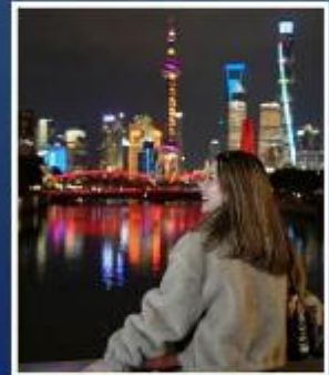
เซี่ยงไฮ้ คลาสสิก ไนท์