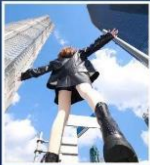
3 ตึกใหญ่แห่งเซี่ยงไฮ้