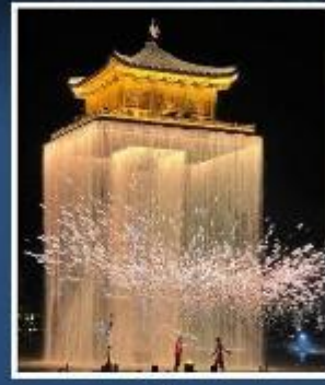
อู๋นวิโจว