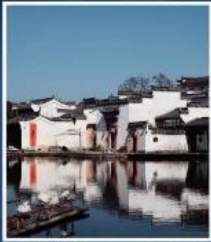
หมู่บ้านโบราณเฉิงชาน