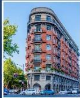
ถนนอู่คัง