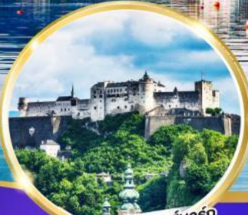
ปราสาทไฮเซนซาลส์บวร์ก