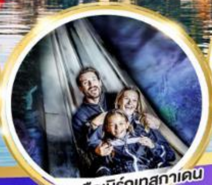
เมืองเกลือเบิร์กเทสกาเดน