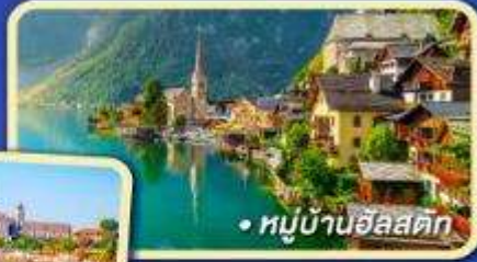
หมู่บ้านอัลสติก