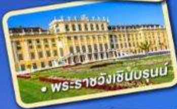
พระราชวังเฮินบรุนน์