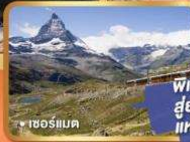
• เซอร์แมต