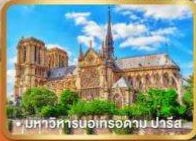
• มหาวิหารนอทร์ดาม ปารีส