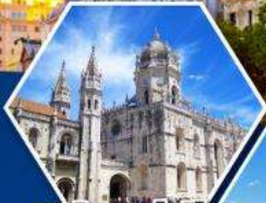
มหาวิหารเจอโรนิโม