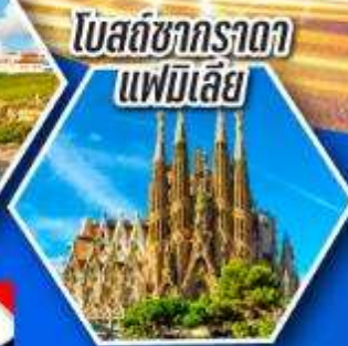
โบสถ์ซากราดา แฟมิเลีย