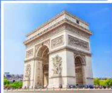
ประตูลีปารีส