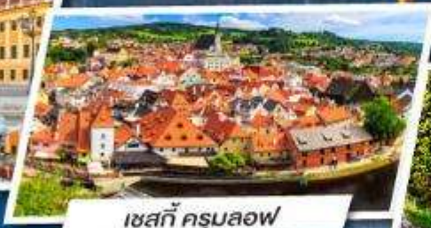
เชสกี ครูมลอฟ