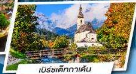
เบียร์ชเต็ทกาเดิน