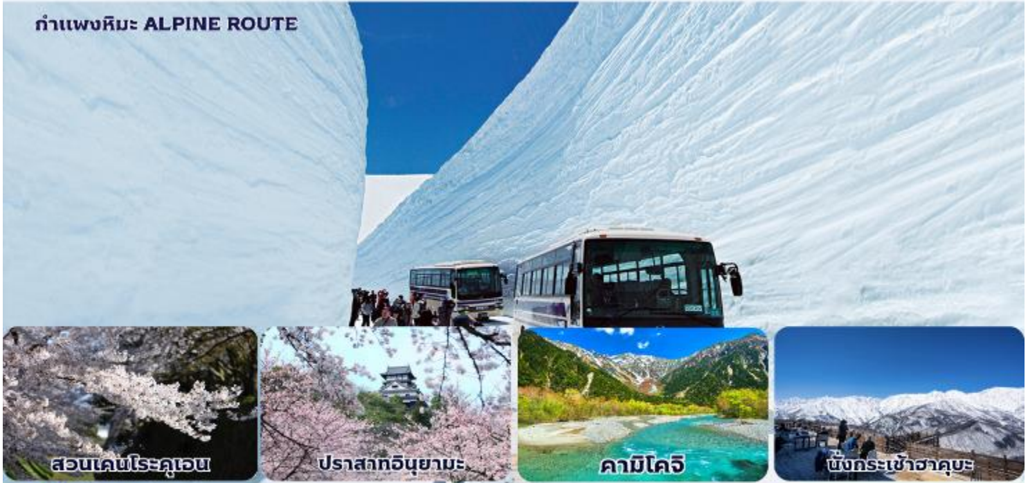
สวนเค็นโระคุออน