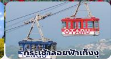
กระเช้าลอยฟ้าเท็งงุ