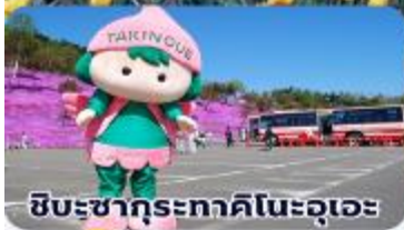
ชิบะซากุระภาคโทโฮคุอะเอะ