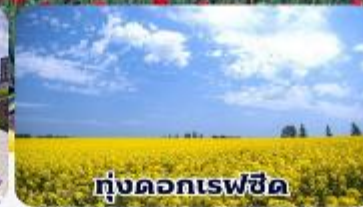
ทุ่งดอกเรพซิด